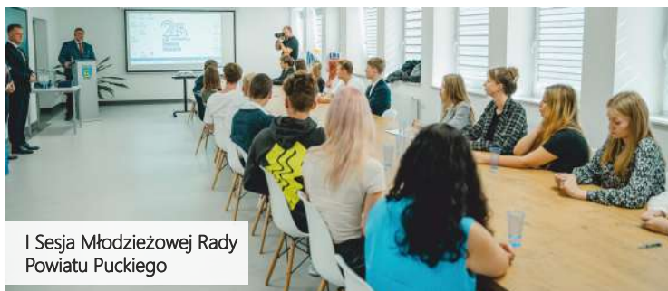
I Sesja Młodzieżowej Rady Powiatu Puckiego

„Powstanie Młodzieżowej Rady Powiatu Puckiego do wspiania perspektywa na kolejne ćwierćwiecze. To nie tylko historyczny moment, ale też obietnica świeżego spojrzenia i zaangażowania młodego pokolenia w rozwój naszej społeczności. Wierzę, że ich energia przyniesie owocne inicjatywy, umacniając naszą wspólnotę na kolejne lata. To dobre potężenie doświadczenia i młodości.”