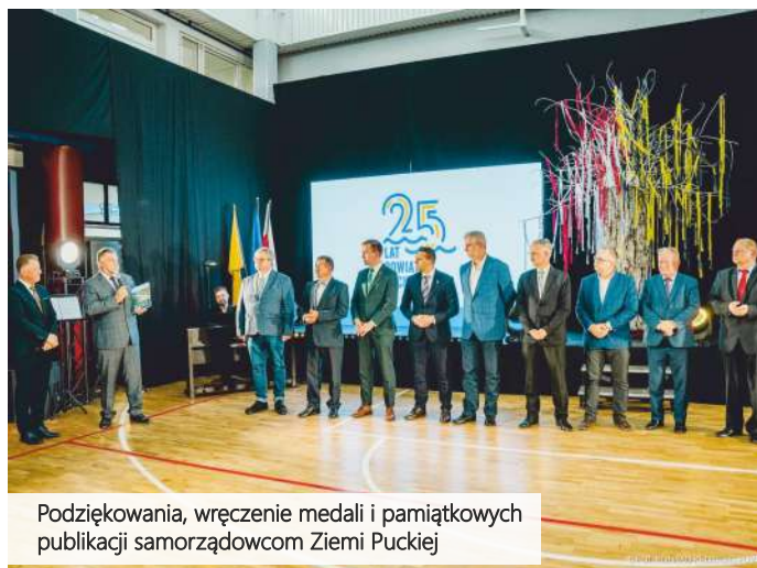
Podziękowania, wręczenie medali i pamiątkowych publikacji samorządowcom Ziemi Puckiej