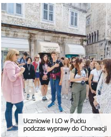
Uczniowie I LO w Pucku podczas wyprawy do Chorwacji

Ta dynamiczna forma nauki otwiera przed nimi nowe horyzonty i stanowi cenny element ich edukacyjnej przygody. Przykładem działań tego typu prowadzonych przez powiatowe szkoły, są wyjazd kulturowy uczniów I LO do Chorwacji czy miesięczne praktyki uczniów PCKZiU w hiszpańskiej Maladze w ramach mobilności programu ERASMUS+. Oba wyjazdy odbyły się na początku roku szkolnego.