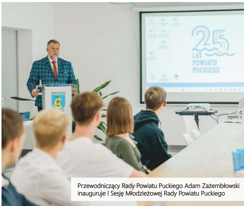
Przewodniczący Rady Powiatu Puckiego Adam Zażembski inauguruje I Sesję Młodzieżowej Rady Powiatu Puckiego

W wyniku wyborów wyłoniono 21 radnych Młodzieżowej Rady Powiatu Puckiego . 12 października 2023 r. w sali konferencyjnej Starostwa Powiatowego w Pucku przy ul. Kolejowej 7B odbyła się I sesja Młodzieżowej Rady Powiatu Puckiego kadencji 2023/2024.