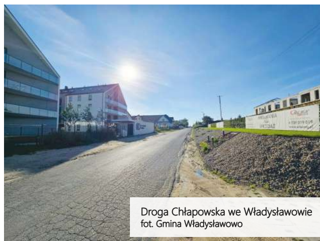
Droga Chłapowska we Władysławowie

Projekt obejmuje fragment ul. Chłapowskiej we Władysławowie od ronda do granic byłego PGR. Prace zakładają budowę chodnika, ścieżki rowerowej, oświetlenia oraz naprawę nawierzchni. Realizacja inwestycji jest obecnie na etapie wykonania dokumentacji projektowej, jednak za parę miesięcy mieszkańcy będą mogli cieszyć się z podniesienia poziomu bezpieczeństwa ruchu drogowego i poprawy warunków komunikacyjnych w tej części miasta.