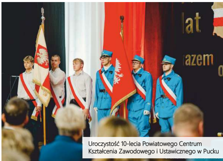
Uroczystość 10-lecia Powiatowego Centrum Kształcenia Zawodowego i Ustawicznego w Pucku

Chorągiew zastąpiła dotychczasowe sztandary, symbolizujące historię placówki pod różnymi nazwami, a ta sięga 1936 roku. W uznaniu wyjątkowego momentu, zaproszeni goście zasadzili drzewa na terenie szkoły, a młodzież zakopała kapsułę czasu, tworząc trwałą pamiątkę wyjątkowego jubileuszu.