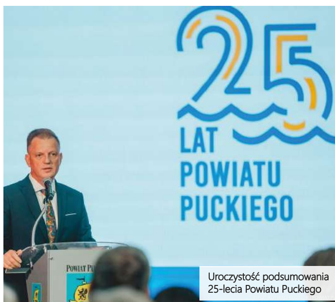
Uroczystość podsumowania 25-lecia Powiatu Puckiego

Wydarzenie zakończyło się wzruszającym występem chóru złożonego z uczniów Państwowej Szkoły Muzycznej im. S. Moniuszki w Pucku , który wykonał kantatę finałową IX symfonii Ludwiga van Beethovena - „Ode do radości”. Utwór ten to między innymi hymn Unii Europejskiej. Po występie odbył się poczęstunek, podczas którego goście mieli okazję do swobodnych rozmów, podzielenia się wrażeniami.