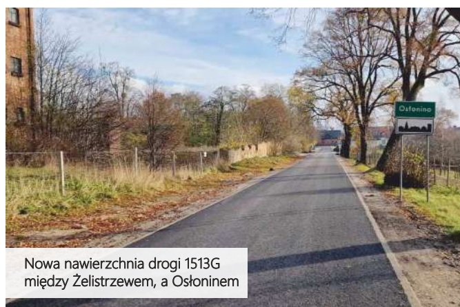
Nowa nawierzchnia drogi 1513G między Żelistrzewem, a Ośloninem

Zakończono również układanie nawierzchni na drodze powiatowej 1513G na odcinku pomiędzy Żelistrzewem a Ośloninem . Droga zyskała nową podbudowę i nawierzchnię usunięte zostały też elementy pogarszające jej stan takie jak kolidująca zieleń czy karpiny drzew, wykonane zostanie oznakowanie pionowe oraz poziome.