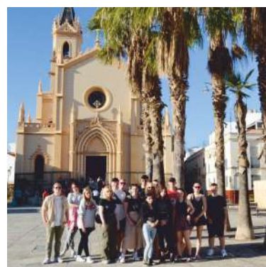
Pierwsze zagraniczne wybory uczniów PCKZiU w Pucku... słoneczna Malaga.