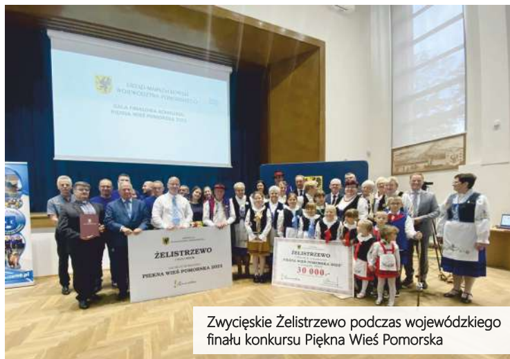
Zwycięskie Żelistrzewo podczas wojewódzkiego finału konkursu Piękna Wieś Pomorska

To pierwsze zwycięstwo sołectwa z Ziemi Puckiej w konkursie „Piękna wieś pomorska” w historii. Brawa dla Żelistrzewa i jego mieszkańców!