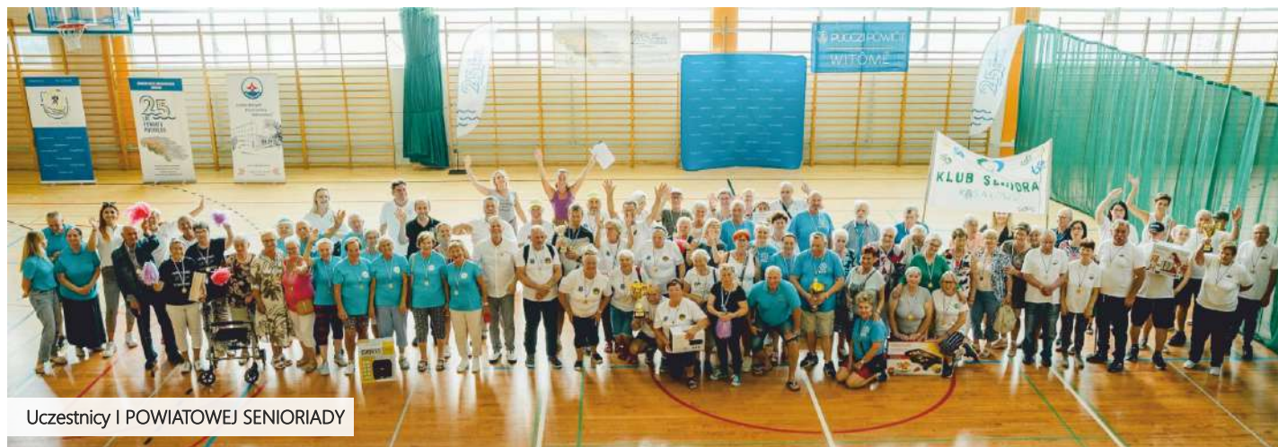
Uczestnicy I POWIATOWEJ SENIORIADY