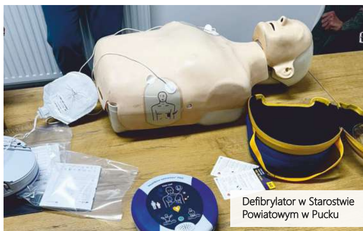
Defibrylator w Starostwie Powiatowym w Pucku

W Starostwie Powiatowym w Pucku, przy ul. Orzeszkowej 5, możemy teraz liczyć na nowego sprzymierzeńca w ratowaniu życia - urząd posiada na wyposażeniu defibrylator, gotowy do wykorzystania przy udzielaniu pomocy podczas nagłego zatrzymania krążenia.