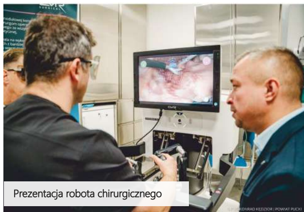
Prezentacja robota chirurgicznego

To jednak nie koniec nowości sprzętowych. Placówka ramach kontynuacji misji dostarczania nowoczesnej opieki medycznej, planuje wprowadzenie robota chirurgicznego na otwarty niedawno blok operacyjny . Ma to nastąpić jeszcze w 2024 roku. Wdrożenie tego zaawansowanego urządzenia umożliwi wykonywanie zabiegów z jeszcze większą niż do tej pory precyzją i mniejszą inwazyjnością.