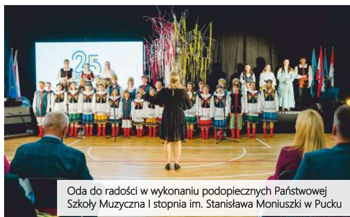
Oda do radości w wykonaniu podopiecznych Państwowej Szkoły Muzyczna I stopnia im. Stanisława Moniuszki w Pucku