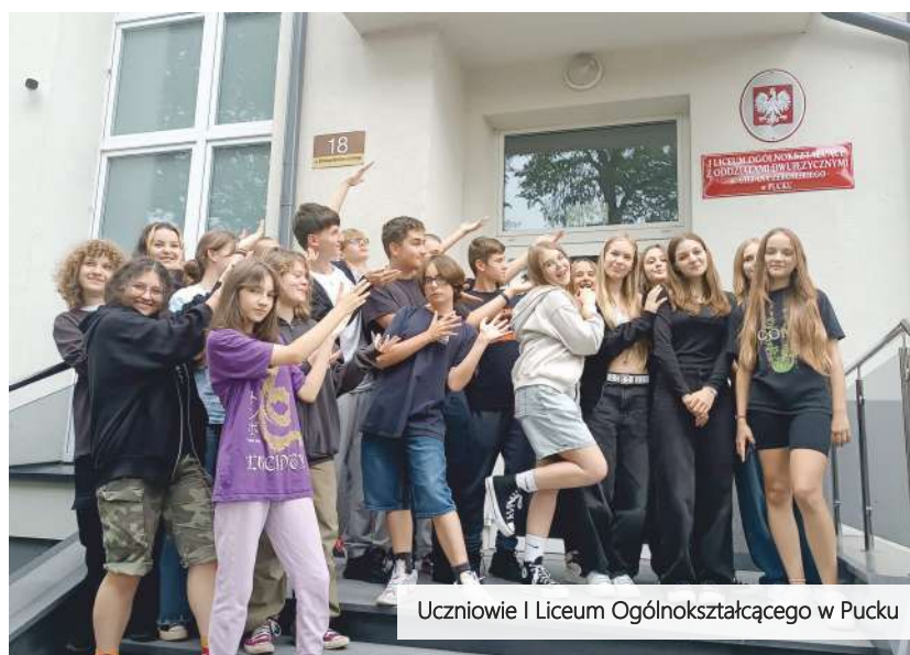
Uczniowie I Liceum Ogólnokształcącego w Pucku

Od 1 września 2023 r. I LO w Pucku przyjęło nazwę: „I Liceum Ogólnokształcące z Oddziałami Dwujęzycznymi im. Stefana Żeromskiego”. Ta nazwa to hołd dla pisarza Stefana Żeromskiego i symbol zobowiązania do nauki języków obcych.