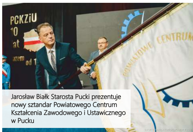
Jarosław Biały Starosta Pucki prezentuje nowy sztandar Powiatowego Centrum Kształcenia Zawodowego i Ustawicznego w Pucku

Gratulujemy społeczności szkolnej przygotowania tak uroczystego wydarzenia i życzymy kolejnych lat wspaniałej działalności i kształcenia kolejnych pokoleń mieszkańców!