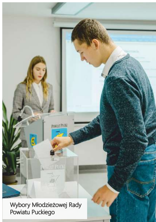
Wybory Młodzieżowej Rady Powiatu Puckiego