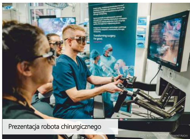
Prezentacja robota chirurgicznego