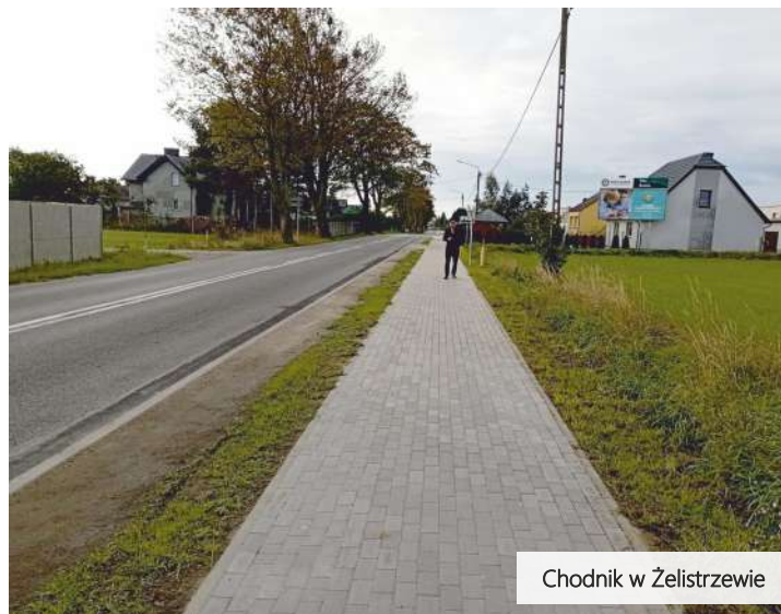
Chodnik w Żelistrzewie

W Żelistrzewie zrealizowano zadanie „Przebudowa drogi powiatowej nr 1511G w zakresie wykonania chodnika w miejscowości Żelistrzewo” polegającego na budowie chodnika z Żelistrzewa w kierunku Pucka, od ul. Celbowskiej do zjazdu w kierunku Rzucewa. Budowa chodnika z Żelistrzewa w kierunku Pucka, od ul. Celbowskiej do zjazdu w kierunku Rzucewa. Długo oczekiwana inwestycja o wartości ponad 850 tysięcy złotych stanowi odpowiedź na długoletnie apele społeczności lokalnej. To ważny krok w poprawie bezpieczeństwa i komfortu podróży dla wszystkich użytkowników.