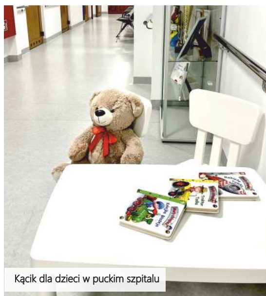
Kącik dla dzieci w puckim szpitalu

Teraz, najmłodszy pacjenci mogą czuć się bardziej komfortowo podczas wizyty związanej z poborem próbek. Inicjatywa ta ma na celu przygotowanie środowiska, które łagodzi stres najmłodszych związanych z zabiegami medycznymi. Pozwala też pokonać nudę w szpitalnej poczekalni.