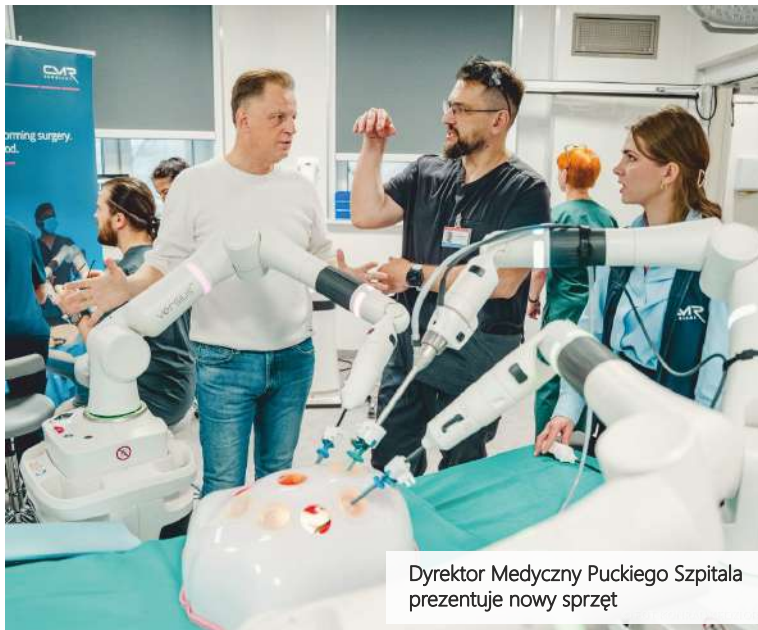
Dyrektor Medyczny Puckiego Szpitala prezentuje nowy sprzęt

W celu poprawy komunikacji wprowadzono też tablety do podpisu dokumentacji elektronicznej i tablety z funkcją „MÓWIK”. Dodatkowo przeprowadzono prace budowlane poprawiające dostępność dla osób niepełnosprawnych - m.in. montaż pochwytów ściennych.