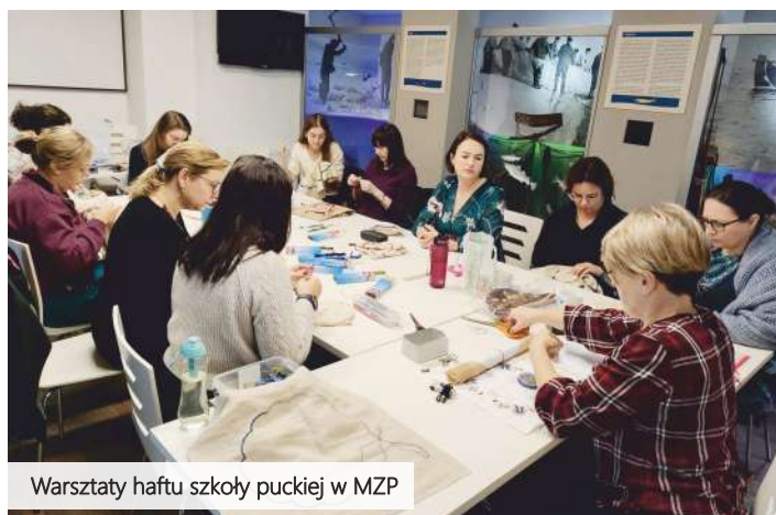
Warsztaty haftu szkoły puckiej w MZP

Trwające od czerwca do grudnia 2023 roku warsztaty haftu, będące częścią projektu „Mistrz Tradycji - Haft Szkoły Puckiej”, dobiegają końca.