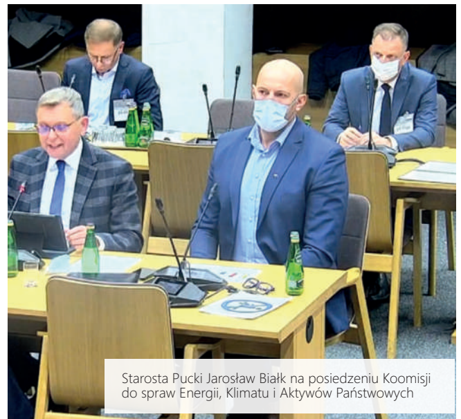
Starosta Pucki Jarosław Biały na posiedzeniu Komisji do spraw Energii, Klimatu i Aktywów Państwowych