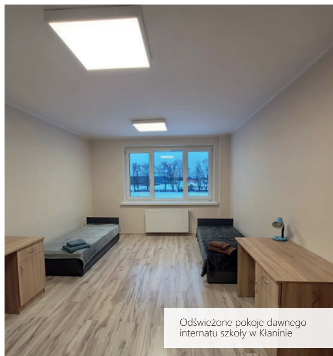
Odświeżone pokoje dawnego internatu szkoły w Kłaninie

Władze ośrodka wyposażą również pomieszczenia i podjęły starania, służące nadaniu temu miejscu przytulnego charakteru. Wszystkie prowadzone działania mają na celu zapewnienie podopiecznym komfortu i ułatwienia startu w dorosłe życie. Tego typu miejsca służą również przeciwdziałaniu wykluczenia społecznego, które często dotyka dzieci i młodzież z rozbitych rodzin.