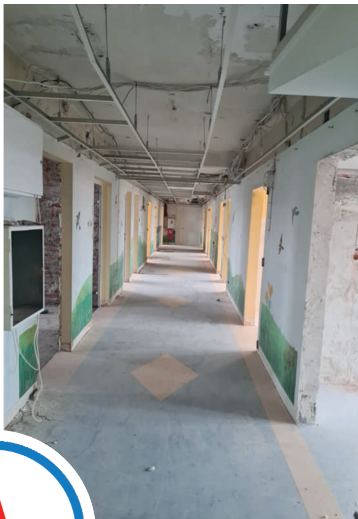
w trakcie remontu