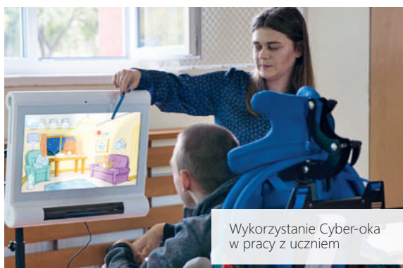
Wykorzystanie Cyber-oka w pracy z uczniem

„Cyber oko”, czyli sprzęt do diagnostyki, pracy terapeutycznej i komunikacji z osobami dotkniętymi niepełnosprawnością został zaprezentowany 27 października 2021 r. w SOSW PUCK na specjalnie zwołanej konferencji. Jego możliwości obserwowali dyrektorzy placówek specjalnych z terenu województwa pomorskiego. Było to pierwsze spotkanie stacjonarne od początku pandemii. Specjalny Ośrodek Szkolno-Wychowawczy w Pucku pochwalił się posiadaniem urządzenia, którego fachowa nazwa to C-EYE II PRO. Jego możliwości są wykorzystywane od roku podczas codziennej pracy z podopiecznymi SOSW w Pucku jest jedną z nielicznych placówek w Polsce, w której dzieci i młodzież z dysfunkcjami mogą uczyć się z wykorzystaniem tego urządzenia. Jego działanie pozytywnie wpływa na ich rozwój oraz poprawę zdolności komunikacyjnych. Przede wszystkim jednak pozwala postawić właściwą diagnozę, co jest podstawą do wdrożenia odpowiedniej terapii.