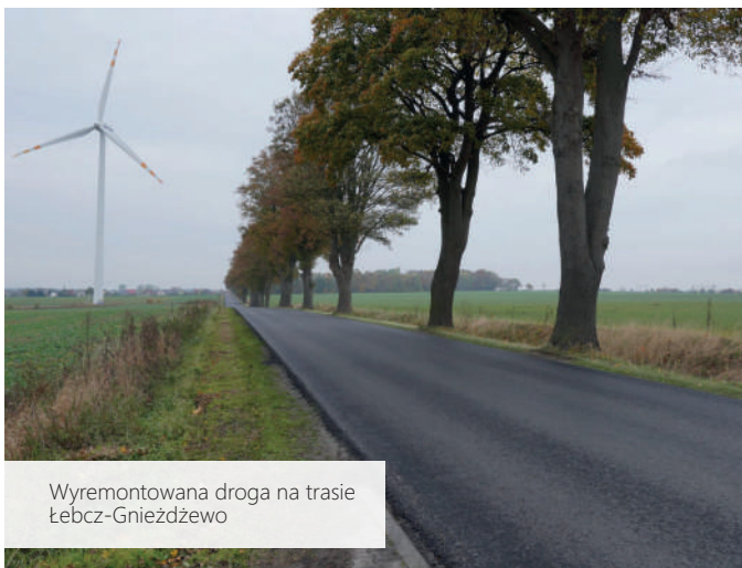
Wyremontowana droga na trasie Łebcz-Gnieźdżewo

Tematem, który wymaga ciągłej uwagi samorządowców, są drogi. Władze powiatu puckiego są tego świadome, dlatego sukcesywnie remontują należące do nich nawierzchnie. W 2021 roku rozpoczął się proces realizacji dwuletniego programu remontów, rozbudowy i poprawy bezpieczeństwa na drogach powiatowych . Prace rozpoczęły się od modernizacji drogi 1506 G na odcinku pomiędzy Łebczem a Gnieźdżewem w Gminie Puck. Wyrównana droga, wyposażona w nową nawierzchnię i infrastrukturę w postaci chodników i zatoczek autobusowych oddana została do użytku w październiku. Inwestycja kosztowała ponad 1,5 miliona złotych i jest częścią zadania za ponad 7,5 mln zł , na które Powiat Pucki pozyskał dofinansowanie z Funduszu Dróg Samorządowych.