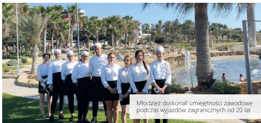
Młodzież doskonali umiejętności zawodowe podczas wyjazdów zagranicznych od 20 lat

Mała szkoła – duże możliwości w branży gastronomicznej i hotelarskiej uczniów ZSP w Kłaninie” jest realizowana w ramach projektu „Ponadnarodowa mobilność uczniów i absolwentów oraz kadry kształcenia zawodowego” finansowanego ze środków POWER na zasadach Programu Erasmus+ sektor Kształcenie i szkolenia zawodowe.