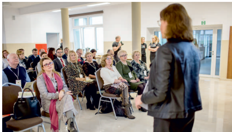
Podsumowanie projektu w ZSP Kłanino

W ramach projektu powstał poradnik „ABC szkoły branżowej w branży kluczowej dla ZSP w Kłaninie - Turystyka, Sport i Rekreacja”, a także prezentacje multimedialne dot. systemu kształcenia i szkolenia zawodowego we Włoszech, dobrych rozwiązań, dobrej praktyki i podejścia do szkolnictwa branżowego oraz zdobytego doświadczenia w ramach współpracy partnerskiej. Zorganizowano też konferencję dydaktyczną, która przyczyni się do wzmocnienia działania sieci współpracy między szkołami w powiecie puckim oraz wejherowskim.