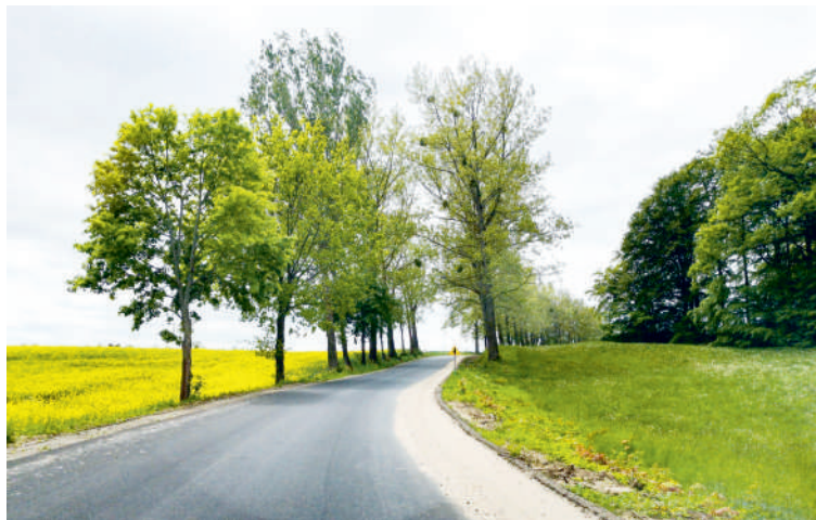
Świecino - Połchówko już bez dziur i nierówności

Droga z Połchówka do Świecina już gotowa po remoncie. Koszt modernizacji odcinka z Połchówka do Świecina o długości 2,6 km wyniósł ponad 1 mln 50 tysięcy złotych . Do tego należy doliczyć ok. 180 tysięcy złotych, które wydatkowała gmina Krokowa na położenie nowego asfaltu na ponad półkilometrowym odcinku ze Świecina do drogi wojewódzkiej nr 218.