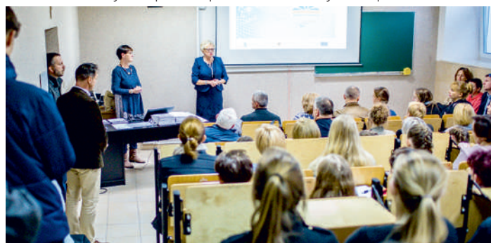
Zdolni z Pomorza w I LO w Pucku