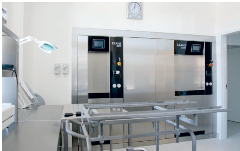
Sterylizatornia jest wyposażona w najnowocześniejszy sprzęt