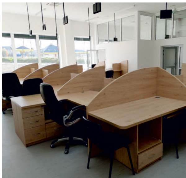
Sala przyjęć interesantów Wydziału Komunikacji