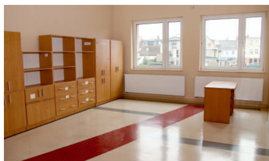
SOSW po termomodernizacji

Zakres robót budowlanych wykonanych w szkole obejmował: docieplenie stropu, wymianę stolarki okiennej, częściową wymianę stolarki drzwiowej zewnętrznej, modernizację instalacji elektrycznej wraz z wymianą oświetlenia ograniczającego zużycie energii elektrycznej; modernizację instalacji CO (wymiana kotła z węglowego na gazową pompę ciepła); wymianę grzejników, modernizację systemu instalacji ciepłej wody użytkowej oraz wykonanie instalacji wentylacji mechanicznej.