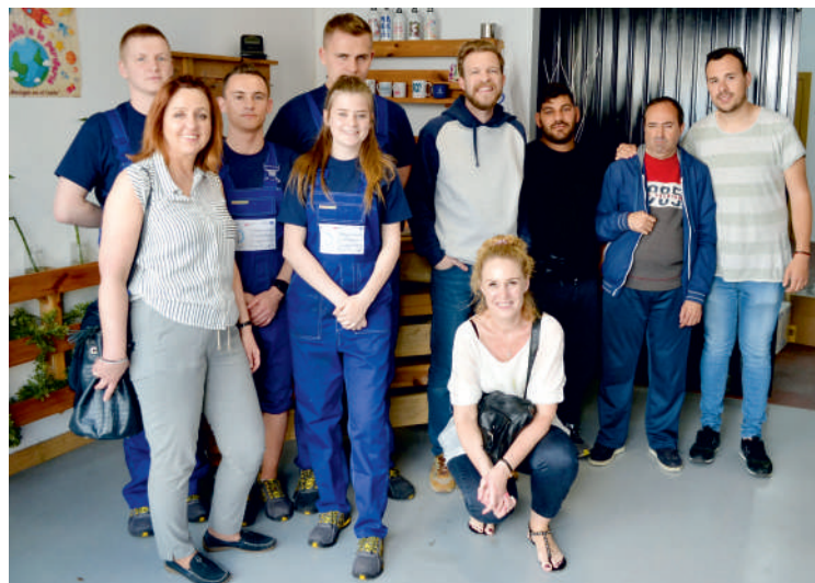
Nasi uczniowie uczyli się zawodu w Hiszpanii