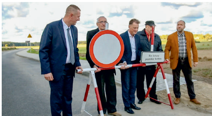
Otwarcie zmodernizowanej drogi w Goszczynie

W ramach inwestycji wykonano: wzmocnienie konstrukcji jezdni, krawężniki, chodnik z Goszczyna w kierunku Łętowic oraz oczywiście nową nawierzchnię asfaltową. Odtworzone zostały też rowy melioracyjne.