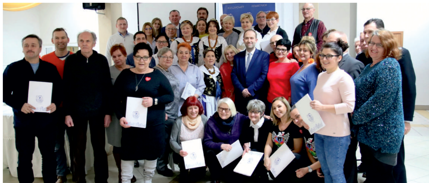
NGO otrzymały granty z Powiatu Puckiego

Na realizację zadań publicznych przez NGO. Powiat Pucki przeznaczył na rok 2019, 170 tysięcy złotych . Środki zostały przekazane na realizację zadań z zakresu: promocji i ochrony zdrowia, edukacji, kultury, kultury fizycznej i turystyki, wsparcia osób niepełnosprawnych, porządku publicznego i bezpieczeństwa obywateli, ekologii i ochrony dziedzictwa przyrodniczego, wypoczynku dzieci i młodzieży oraz działalności na rzecz integracji europejskiej oraz rozwijania kontaktów i współpracy między społecznościami.