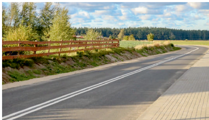
Nowy asfalt na drodze Sławoszynko - Karwieńskie Błoto Drugie - Goszczyno