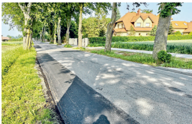
„Duże łaty” na drodze powiatowej

Koszt wykonanych prac to ponad 430 tysięcy złotych .