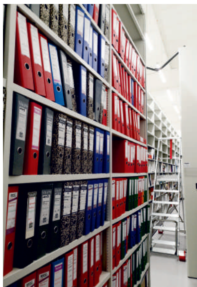
To tylko część olbrzymiego archiwum puckiego starostwa

Wydział Geodezji, Kartografii i Katastru, Wydział Komunikacji oraz Wydział Architektury i Budownictwa już w jednym miejscu.