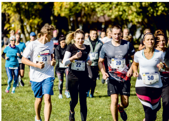
Biegli na rzecz rodzicielstwa zastępczego