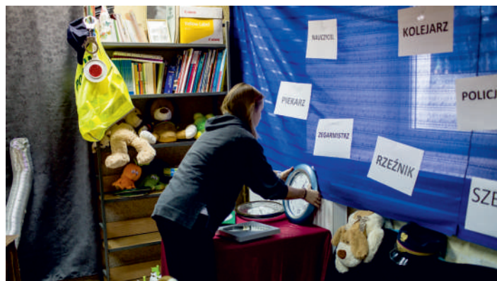
Tradycyjnie na targach nie zabrakło escape room'u