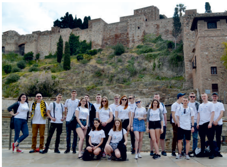
Uczniowie PCKZiU w Maladze

Przyszli logistycy podczas praktyk w hiszpańskich firmach logistycznych sporządzali dokumenty dotyczące przepływu między ogniwami kanału dystrybucji w języku angielskim i hiszpańskim, nadzorowali przebieg procesów magazynowych, organizowali czynności związane z przygotowaniem ładunku do przewozu i przechowywania, zapoznawali się z dokumentowaniem procesów logistycznych w języku angielskim i hiszpańskim. Niewątpliwą wartością jest pogłębienie umiejętności posługiwania się językiem obcym w tym także zawodowym.