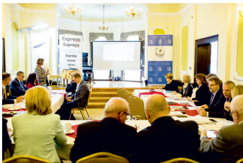
Konwent starostów obradował w Kłaninie