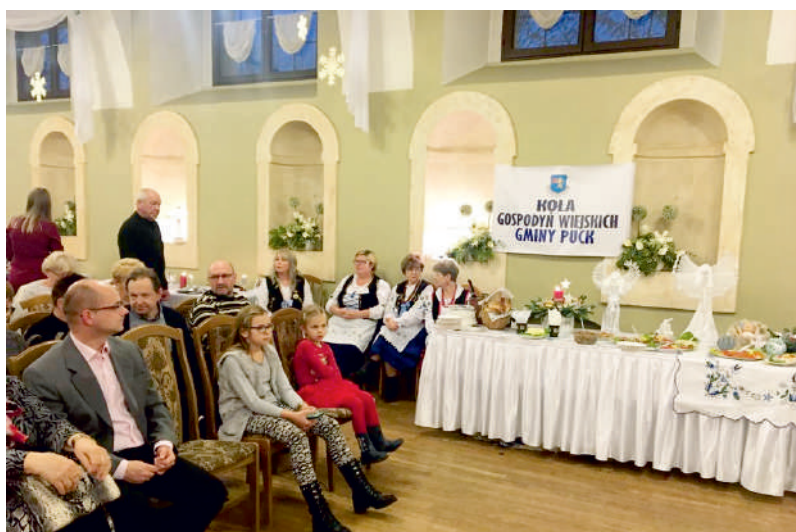
Promocja kuchni kaszubskiej na Śląsku