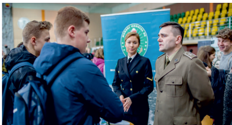
Służby mundurowe wciąż cieszą się dużym zainteresowaniem

Wzorem roku ubiegłego, na targach wręczono nagrody dla zwycięzców konkursu pt. „Dlaczego moja szkoła jest wyjątkowa?”. Organizatorami targów byli: Powiat Pucki oraz Powiatowy Urząd Pracy w Pucku.