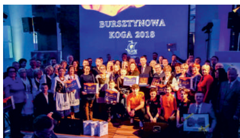
Bursztynowe Kogi za rok 2018