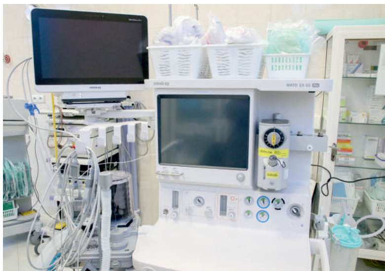
Nowoczesny sprzęt dla Szpitala Puckiego

Zakupiony sprzęt obejmuje narzędzia chirurgiczne, aparat do znieczulenia wraz z monitorem, bronchofiberoskop, defibrylator, aparat elektrochirurgiczny, kardiomonitor, łóżko elektryczne z materacem, respirator oraz wózek zabiegowo-transportowy.