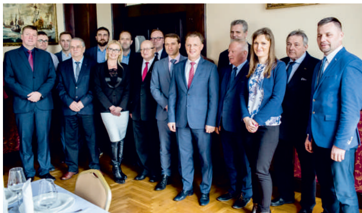
Samorządowcy Powiatu Puckiego spotkali się w Kłaninie

Pierwszy w tym roku Konwent Samorządów Powiatu Puckiego odbył się w Kłaninie w gm. Krokowa. Na spotkaniu dyskutowano o konieczności ochrony wód Zatoki Puckiej i jej zarybianiu. Starosta zaprosił wójtów i burmistrzów do współpracy w tym zakresie. Poinformował też, że teren powiatu – w wyniku prowadzonych od kilku lat prac geodezyjnych - od stycznia 2021 roku powiększy się o obszar Zatoki Puckiej.