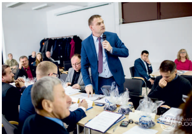
Ostatnie dyskusje nad budżetem powiatu na rok 2019

Środki te zaplanowano m.in. na remont drogi powiatowej nr 1522G na odcinku Świecino - Połchówko oraz remont drogi powiatowej nr 1517G (ul. Morska) w Rewie, a także na bieżące utrzymanie dróg.