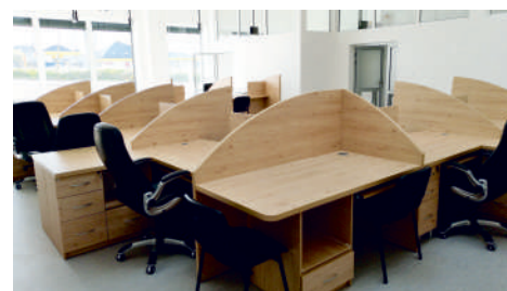
Nowy budynek Starostwa Powiatowego w Pucku