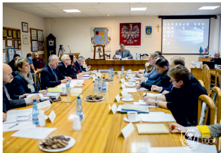
Nowa rada po raz pierwszy razem