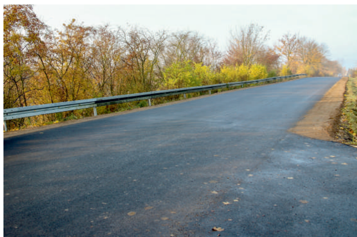
Poprawia się jakość drogi do Rzucewa

Jesienią przeprowadzony został pierwszy etap remontu drogi z Małego Bładzikowa do Rzucewa. W ramach tego zadania powstało niespełna 600 metrów nowej drogi.