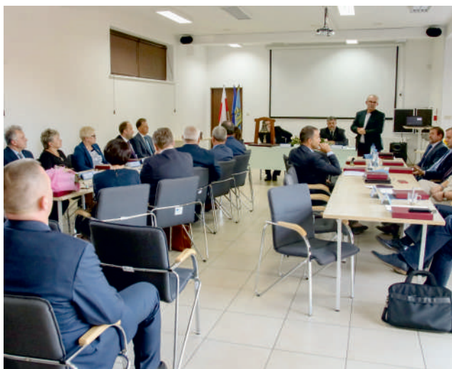
Ostatnia sesja poprzedniej Rady Powiatu Puckiego