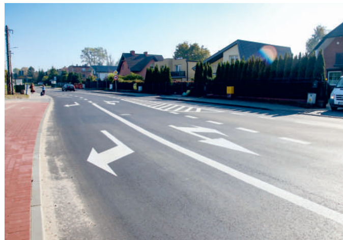
Nowe skrzyżowanie w Kosakowie ułatwiło życie kierowców