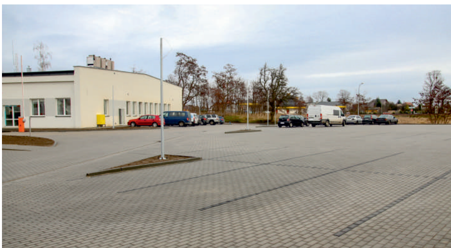
Nowy parking przy ul. Kolejowej w Pucku

W ramach inwestycji uporządkowano teren przy zbiorniku wodnym przy ul. Kolejowej oraz utworzono parking. Zniknęły też dzięki wysypiska oraz uporządkowano teren Powiatowego Centrum Kształcenia Zawodowego i Ustawicznego.