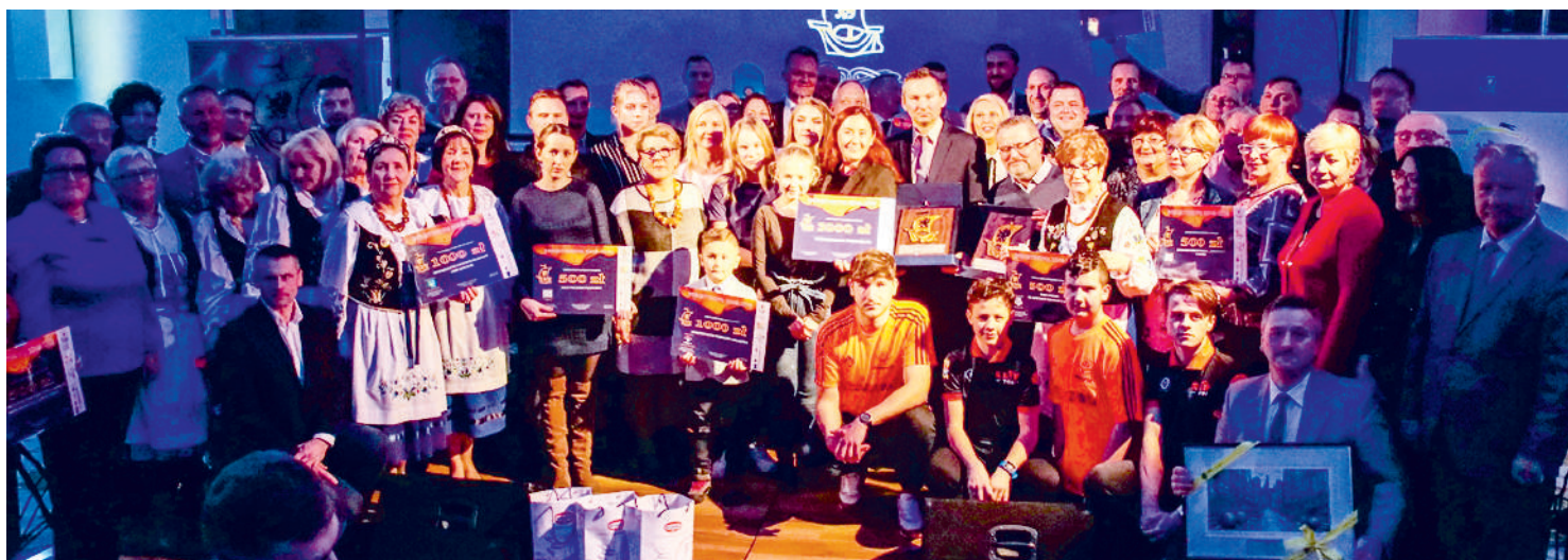
Laureaci Bursztynowej Kogi za rok 2018

Jubileuszowa - X gala nagród Bursztynowej Kogi odbyła się w gościnnych murach hotelu Primavera w Jastrzębiej Górze. Nagroda ta jest uhonorowaniem najlepszych organizacji pozarządowych Ziemi Puckiej przez Starostę Puckiego oraz Powiatową Radę Organizacji Pozarządowych.