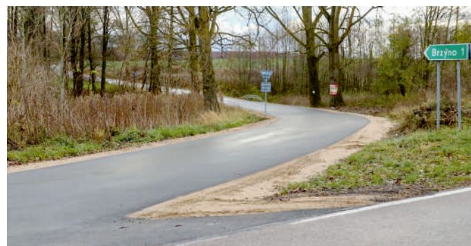
Nowy asfalt na drodze do Brzyna

W czasie prac usunięto też drzewa i krzewy oraz uzupełniono pobocza.