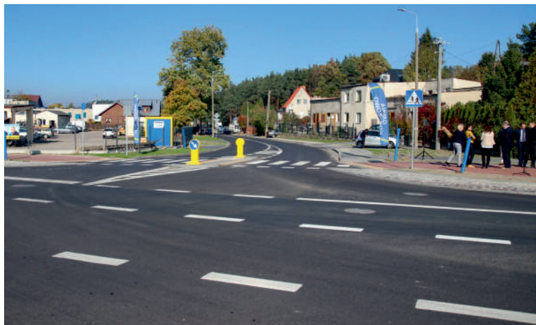
Skrzyżowanie ul. Rzemieślniczej i Chrzanowskiego w Kosakowie

Całkowity koszt inwestycji to 1 mln 790 tys złotych , z czego udział gminy Kosakowo wyniósł nieco ponad 1 mln złotych, a udział Powiatu Puckiego 740 tys zł.