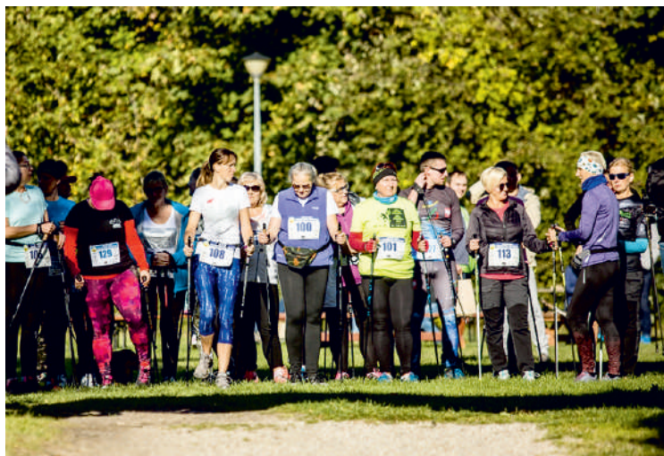
Marsz nordic walking cieszył się dużym zainteresowaniem

Każdy uczestnik otrzymał pamiątkowy medal oraz dyplom, a także poczęstunek. W czasie imprezy można było uzyskać sporo informacji na temat rodzicielstwa zastępczego.