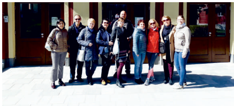
Z wizytą w partnerskiej szkole

W czasie wyprawy, uczniowie i nauczycieli m.in. zwiedzili muzeum i dom mieszkalny Sigmunda Freuda, a także Ostrawę i Pragę.