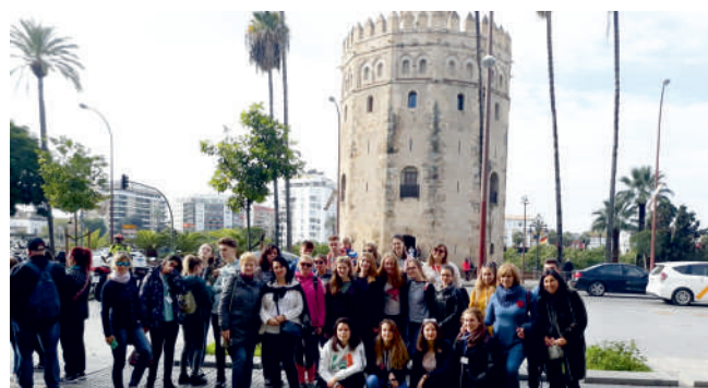
NORDA BIULETYN INFORMACYJNY POWIATU PUCKIEGO

Uczestnicy wymiany wzięli też udział w festiwalu filmowym, na którym obejrzeli film pt. „Jellyfish” o problemach współczesnego świata - o przemocy, wykorzystywaniu nieletnich oraz o prześladowaniach.