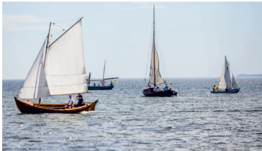
Kaszubskie łódzie Pod Żaglami

Największym sukcesem społeczeństwa obywatelskiego jest działalność organizacji pozarządowych. W Powiecie Puckim wyjątkowo prężną działalność ukazuje każdego roku konkurs na realizację zadań publicznych. Ponad sto złożonych ofert i wsparcie z budżetu powiatu 62 aktywności to naprawdę imponujący wynik. Największym zainteresowaniem cieszą się wydarzenia sportowe i kulturalne. Poniżej przedstawiamy kilka propozycji na sezon letni.