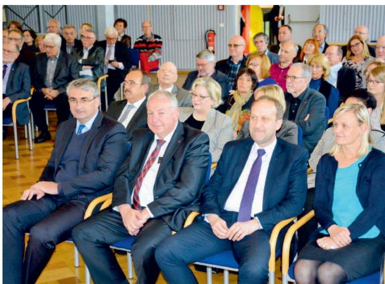
Obchody „Dnia Współpracy Partnerskiej” w Trewirze