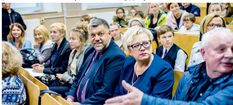
Kolejna edycja programu Zdolni z Pomorza

Najzdolniejsi uczniowie korzystają z dodatkowych zajęć oraz jeżdżą na warsztaty organizowane przez siedem uczelni wyższych w naszym województwie. Otrzymują też stypendia i biorą udział w obozach naukowych. Mają też szansę na uzyskanie opieki mentorskiej pracowników naukowych. Na realizację projektu w latach 2016 - 2020 Powiat Pucki otrzymał ponad pół miliona złotych wsparcia.