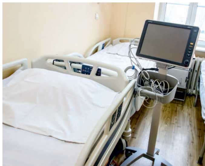
Nowe łóżka elektryczne