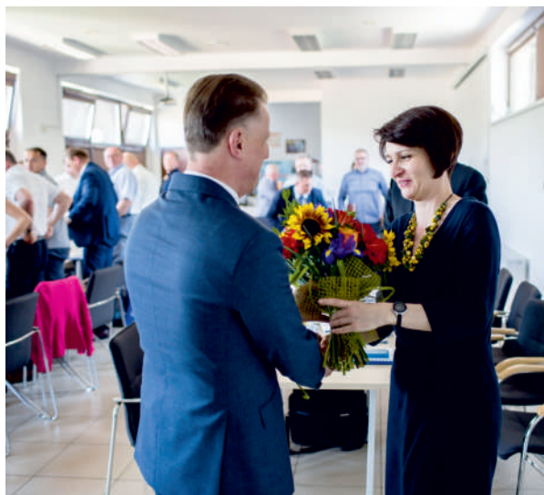
Skarbnik Powiatu Puckiego odbiera podziękowania z rąk starosty

Rada Powiatu Puckiego – większością głosów – udzieliła absolutorium Zarządowi Powiatu Puckiego za wykonanie ubiegłorocznego budżetu.