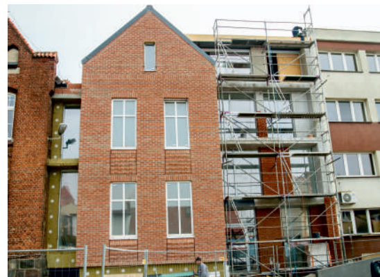
Po latach oczekiwania Szpital Pucki zyska windy i jeszcze więcej

Obecnie trwają prace wykończeniowe oraz połączenie nowego obiektu ze starymi budynkami.