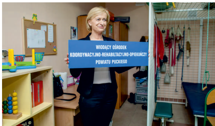
Specjalny Ośrodek Szkolno - Wychowawczy czekają nowe wyzwania

Oznacza to, że od SOSW będzie się zajmować rehabilitacją dzieci niepełnosprawnych w większym niż dotąd stopniu. Co więcej – obejmie opieką też ich rodziny. W ramach umowy podpisanej przez Zarząd Powiatu Puckiego z Ministerstwem Zdrowia, SOSW w Pucku zakupił też dodatkowy sprzęt rehabilitacyjny.