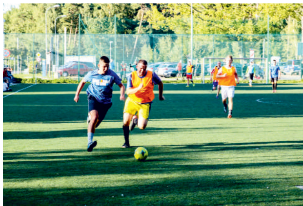
Emocji na helskim boisku nie brakowało