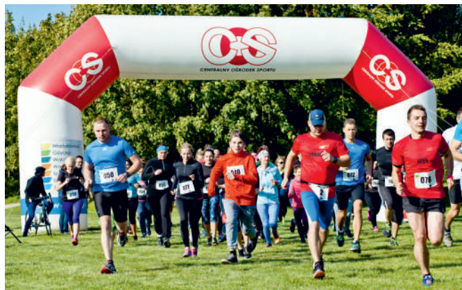
We Władysławowie pobiegli w szczytnym celu

We Władysławowie odbył się I Bieg na Rzecz Rodzicielstwa Zastępczego. Imprezę zorganizowały wspólnie Centrum Kultury, Promocji i Sportu we Władysławowie oraz Powiatowe Centrum Pomocy Rodzinie w Pucku.