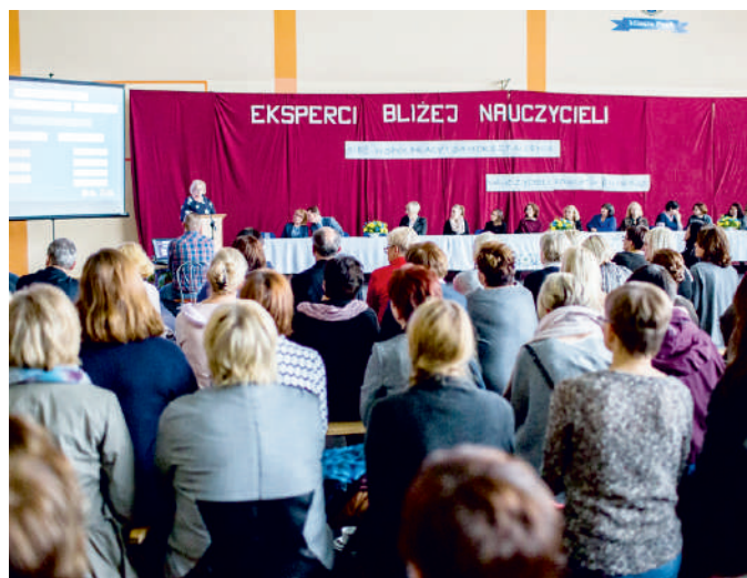
Nauczyciele - liderzy na inauguracji sieci doradztwa

Celem działania sieci współpracy jest: poszerzenie kompetencji nauczycieli, podniesienie wiadomości i umiejętności z danego przedmiotu, a także podniesienie jakości nauczania i osiągnięć edukacyjnych uczniów.