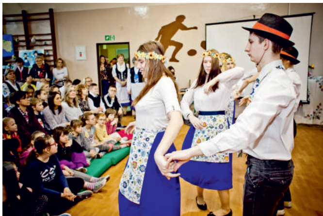
Już od 20 lat pucki SOSW wypełnia kaszubska kultura

Barwnie, radośnie i po kaszubsku. W Specjalnym Ośrodku Szkolno Wychowawczym w Pucku po raz XX odbyły się warsztaty regionalne „Cudze chwalicie, swego nie znacie”.