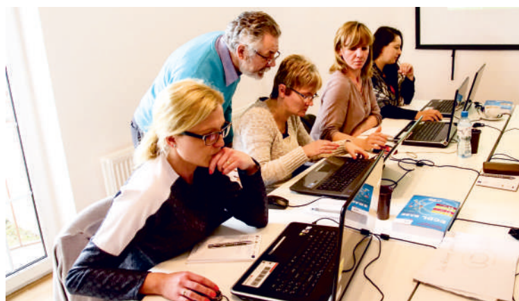
Uczestnicy projektu w trakcie szkoleń

Powiat Pucki w partnerstwie z Fundacją Phenomen realizuje projekt „Aktywizacja zawodowa osób pozostających bez pracy w Powiecie Puckim - etap I” współfinansowany ze środków Europejskiego Funduszu Społecznego Unii Europejskiej w ramach Regionalnego Programu Operacyjnego Województwa Pomorskiego na lata 2014-2020. Jego wartość to ponad 980 tysięcy złotych, z czego nieco ponad 930 tysięcy to unijne dofinansowanie.