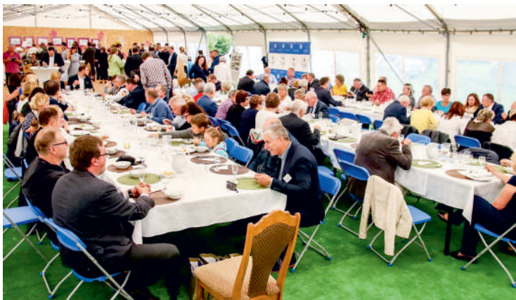
Festiwal Ryby i Wina cieszył się dużym zainteresowaniem

Przedsięwzięcie zorganizowały wspólnie: Powiat Pucki, powiat Trier-Saarburg, Stowarzyszenie Północnokaszubska Lokalna Grupa Rybacka oraz Stowarzyszenie Turystyczne „Kaszuby Północne” Lokalna Organizacja Turystyczna.