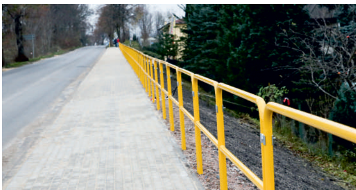
Chodnik w Mostach poprawił bezpieczeństwo pieszych

Poprawie bezpieczeństwa pieszych służy nowy chodnik oraz sygnalizacja świetlna przy ul. Gdyńskiej w Mostach. To wspólna inwestycja Powiatu Puckiego i gminy Kosakowo, która kosztowała ponad 175 tysięcy złotych (budowa chodnika). Budowę sygnalizacji w całości sfinansowała gmina Kosakowo.