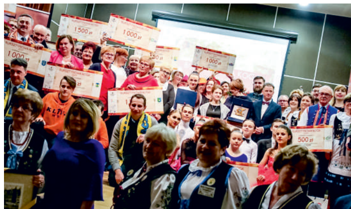
Najlepsi społecznicy Ziemi Puckiej

Serdecznie gratulujemy wszystkim nagrodzonym i wyróżnionym!