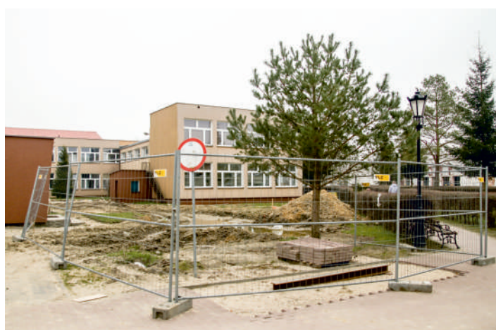
Na placu między budynkami szkoły powstanie nowy łącznik

Trwa rozbudowa Powiatowego Centrum Kształcenia Zawodowego i Ustawicznego w Pucku. Prace mają się zakończyć przed wakacjami przyszłego roku.