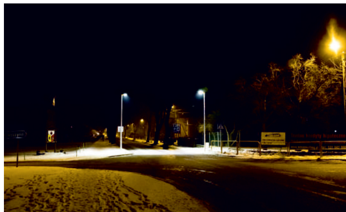
Nowoczesne oświetlenie typu LED w Żelistrzewie

Poprawie bezpieczeństwa pieszych służy nowe oświetlenie przejścia na ul. Kasztanowej w Żelistrzewie - przy sklepie Biedronka i skrzyżowaniu z ul. Łąkową.