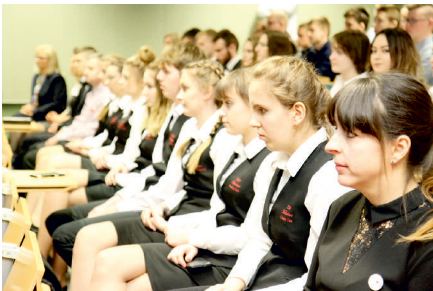
Uczniowie ZSP Kłanino jednymi z najbardziej pomysłowych na Pomorzu

Blisko 200 uczniów z Pomorza wzięło udział w konkursie projektów „Razem do zawodu”. Wśród najlepszych – uczniowie ZSP Kłanino i PCKZiU w Pucku.