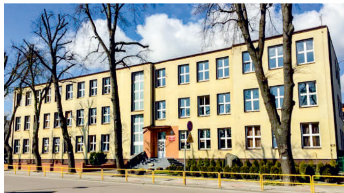
Pucki ogólniak doczeka się termomodernizacji

Prace potrwają od czerwca do września i zostaną zakończone przed rozpoczęciem nowego roku szkolnego.