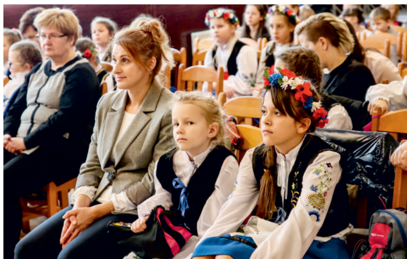
Młodym ludziom kultura kaszubska nie jest obca