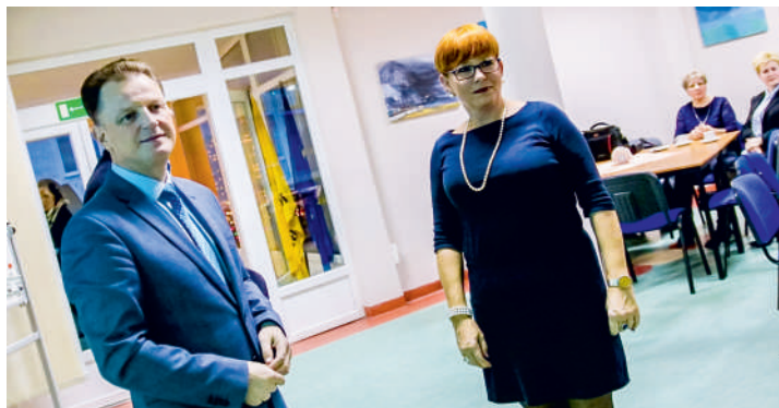
Amazonki otrzymały grant z rąk starosty

Całkowita kwota przyznanych dotacji to 170 tysięcy złotych, a pełna lista przyznanych dotacji jest dostępna na stronach internetowych Biuletynu Informacji Publicznej Starostwa Powiatowego w Pucku.