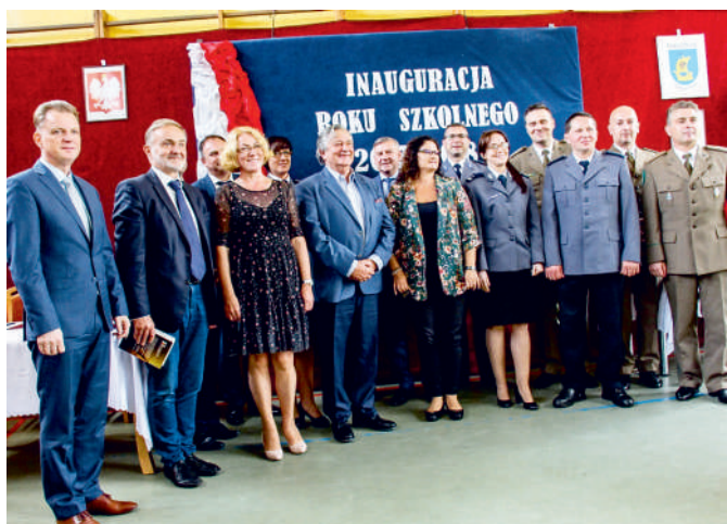
Inauguracja roku szkolnego 2017-2018 w Powiecie Puckim

Powiatowa Inauguracja Roku Szkolnego 2017/2018 odbyła się w Zespole Szkół Ponadgimnazjalnych w Kłaninie. W czasie uroczystości podsumowano pierwszy rok funkcjonowania klasy o profilu stoczniowym i omawiano plany jej rozwoju – we współpracy ze stoczniami oraz miastem Gdynia.