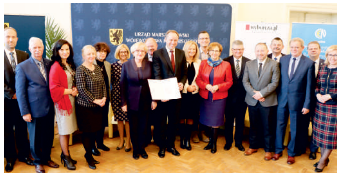
Pomorscy samorządowcy razem dla lepszej edukacji

Działania realizowane w ramach podjętej współpracy będą prowadzić do przyjęcia wspólnej regionalnej polityki edukacyjnej, zgodnej z polityką oświatową państwa, stanowiącej Pomorski System Jakości Edukacji. List sygnowali wszyscy pomorscy starostowie oraz marszałek województwa pomorskiego. Podpisanie odbyło się w Centrum Edukacji Nauczycieli w Gdańsku.