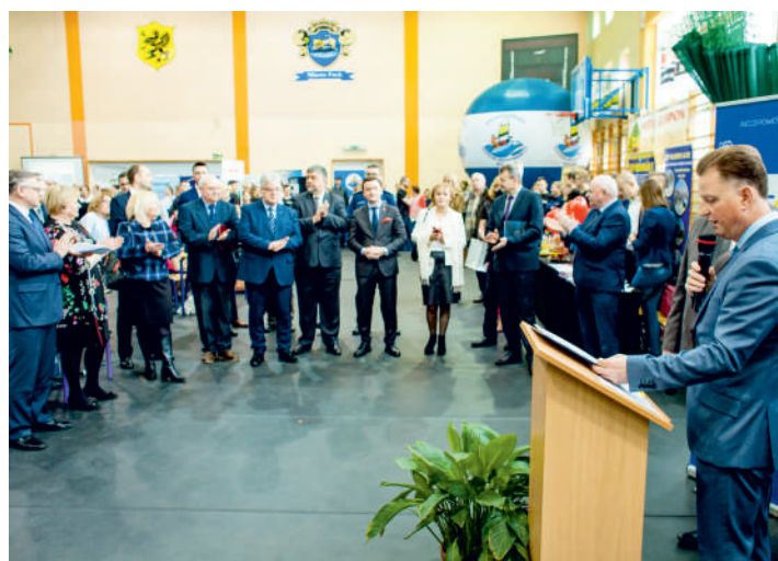
Miejsce gdzie łączą się: edukacja, praca i biznes