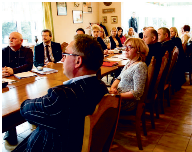
Nauczyciele też się uczą – jak lepiej promować swoje szkoły