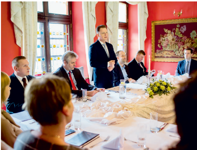
Samorządowcy Ziemi Puckiej spotkali się w Krokowej

Na Konwencie Samorządów Powiatu Puckiego omawiano również kwestie turystyki i tworzenia tzw. „pakietów turystycznych”.