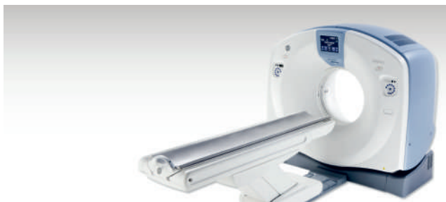
Tomokomputer dla Szpitala Puckiego to olbrzymi skok jakościowy

Szpital w Pucku wzbogacił się o nowoczesny tomograf komputerowy, który będzie służyć do bardzo dokładnej diagnostyki obrazowej. Koszt zakupu urządzenia oraz dodatkowego sprzętu to 2,1 mln złotych. Placówka otrzymała na ten cel wsparcie w wysokości 85 % z Regionalnego Programu Operacyjnego Województwa Pomorskiego na lata 2014-2020.