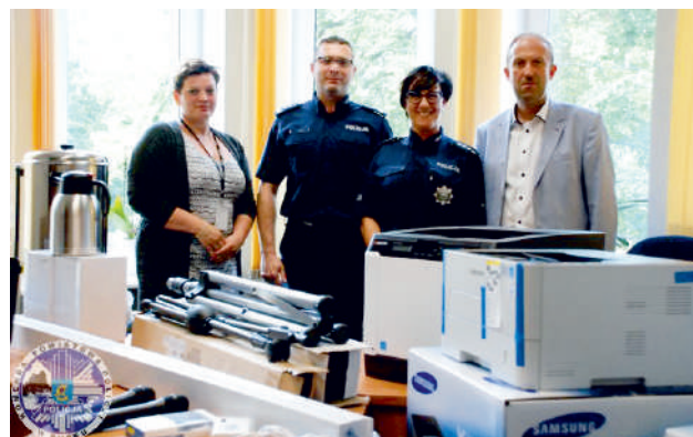
Nowy sprzęt biurowy dla puckiej policji

Tekst i zdjęcia: KPP w Pucku (oprac. własne)