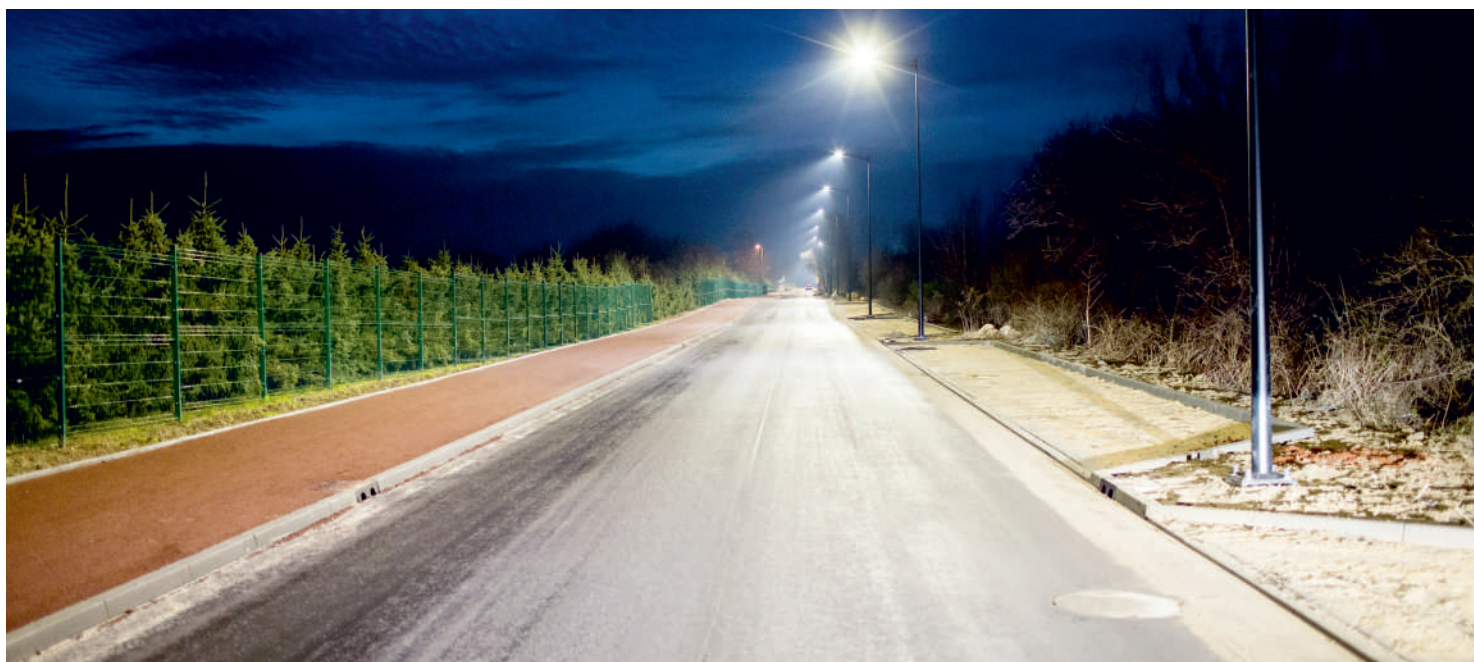
Ul. Żwirowa we Władysławowie już ukończona

Zakończyła się długo oczekiwana przebudowa ul. Żwirowej we Władysławowie. Inwestycja kosztowała ponad 5 mln 100 tysięcy złotych. Zrealizował ją Powiat Pucki we współpracy z gminą Władysławowo.