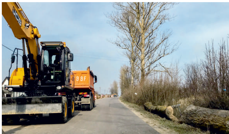
Rozpoczyna się modernizacja drogi z Władysławowa do Łebcza

Koszt inwestycji wspólnie pokryją: Powiat Pucki oraz gminy Władysławowo i gmina Puck. Inwestycja uzyskała dofinansowanie z "Programu Rozwoju Gminnej i Powiatowej Infrastruktury Drogowej"