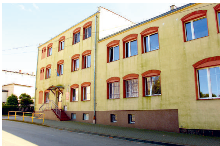
Termomodernizacja budynków to duże oszczędności w utrzymaniu

Termomodernizacja obu budynków będzie kosztować blisko 4 miliony złotych . Prace obejmą m.in. wymianę okien, drzwi, docieplenie dachów i ścian oraz starych węglowych pieców centralnego ogrzewania na nowoczesne piece gazowe.