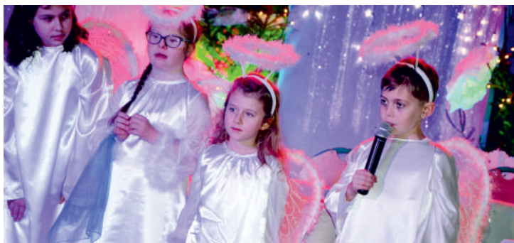
Charytatywna impreza od lat przyciąga ludzi dobrej woli

W ostatnich dniach 2017 roku w hali Powiatowego Ośrodka Sportu Młodzieżowego odbył się tradycyjny świąteczny koncert charytatywny „Dzieci Dzieciom”.