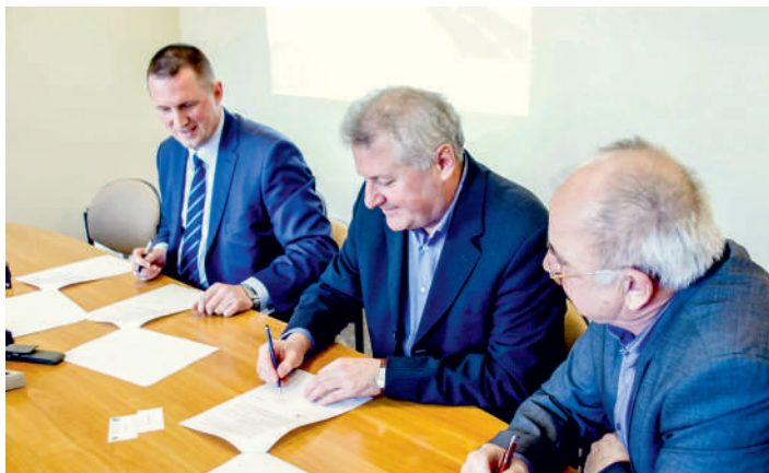
Podpisanie umowy na remont drogi Sławoszynko - Karwieńskie Błoto Drugie – Goszczyno

Na terenie gminy Krokowa rozpoczyna się przebudowa drogi powiatowej 1503G Sławoszynko - Karwieńskie Błoto Drugie – Goszczyno.