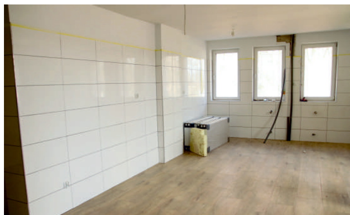
Nowe pracownie w ZSP Kłanino nabierają kształtów

1 mln 100 tysięcy złotych będzie kosztować budowa 10 pracowni zawodowych w Zespole Szkół Ponadgimnazjalnych w Kłaninie. Prace ruszyły we wrześniu ubiegłego roku i zbliżają się do końca.