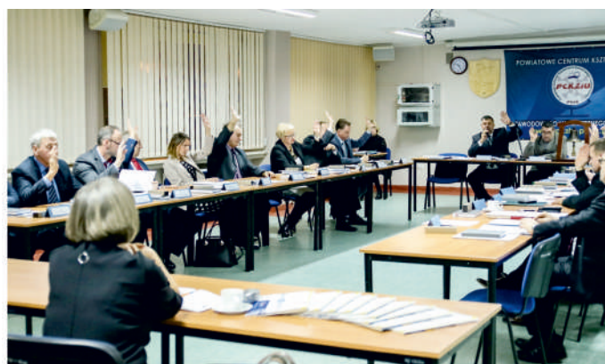
Budżet Powiatu Puckiego na rok 2018 uchwalony