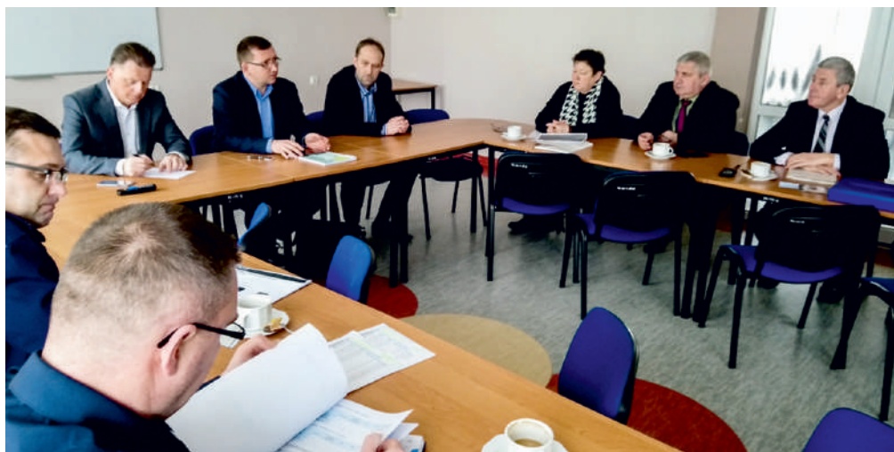
Dyskusja o stanie dróg wojewódzkich na terenie Ziemi Puckiej