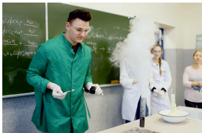
Nauka chemii w LO nabrała zupełnie nowej jakości

Przeprowadzono też remont pracowni chemicznej, który pochłonął 62 tys. złotych. Zakres prac obejmował m.in.: wymianę posadzki i montaż w jej miejsce specjalnego, atestowanego tworzywa odpornego na działanie różnego rodzaju odczynników stosowanych na zajęciach, budowę systemów wentylacyjnych i wymianę oświetlenia, zakup i montaż profesjonalnego dygestorium chemicznego oraz stołu demonstracyjnego do przeprowadzania doświadczeń, a także specjalnej, wentylowanej szafy na odczynniki i szafy na naczynia laboratoryjne. Środki na ten cel przeznaczyło Starostwo Powiatowe w Pucku.