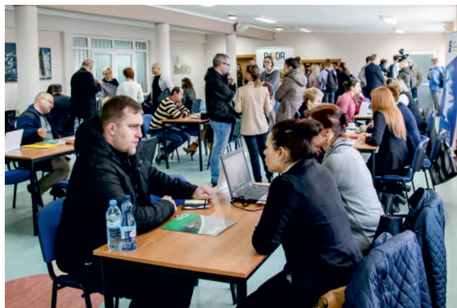
Promocja przedsiębiorczości w Pucku

Przeprowadzono również warsztaty pn. „Zakładanie firmy”, które prowadzili pracownicy PUP, ZUS i US oraz przedsiębiorcy z Powiatu Puckiego.