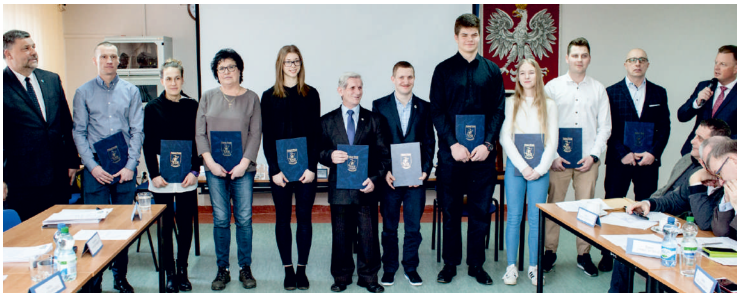
Powiat Pucki nagrodził najlepszych sportowców

W marcu radni Powiatu Puckiego przyjęli m.in. uchwały zmieniające tegoroczny budżet oraz wieloletnią prognozę finansową, uchwałę w sprawie emisji obligacji oraz ustalili zadania na które Powiat Pucki przeznaczy w tym roku środki z PFRON. Na sesji przyjęto też sprawozdanie dyrektora Powiatowego Centrum Pomocy Rodzinie w Pucku oraz sprawozdania z realizacji programów współpracy z organizacjami pozarządowymi oraz programu promocji zatrudnienia i aktywizacji lokalnego rynku pracy w Powiecie Puckim na lata 2014- 2017.