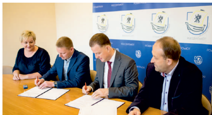
Podpisanie umowy na termomodernizację DPS w Pucku

Inwestycja, na którą Powiat Pucki pozyskał unijne wsparcie, pochłonie nieco ponad 1 mln złotych .