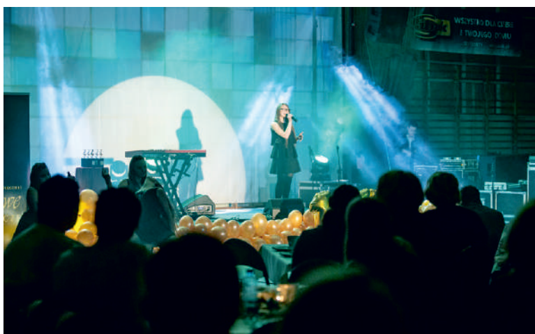
Na scenie prezentowali się młodzi artyści z Powiatu Puckiego

Jubileuszowa - X edycja konkursu wokalnego „Bursztynowe Klucze” odbyła się w hali Powiatowego Ośrodka Sportu Młodzieżowego w Pucku.