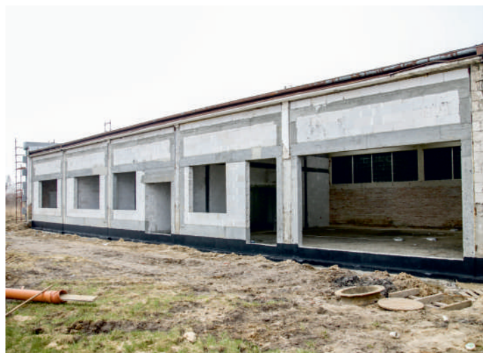
Nowy budynek administracyjny ułatwi życie interesantom i urzędnikom

Druga część dawnych warsztatów Powiatowego Centrum Kształcenia Zawodowego i Ustawicznego również przejdzie termomodernizację i otrzyma zupełnie nową funkcję – stanie się budynkiem administracyjnym.