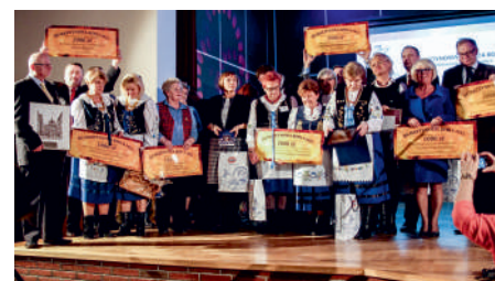
BURSZTYNOWA KOGA 2015