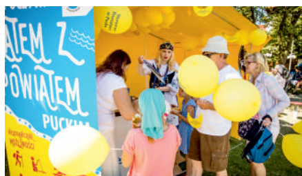
LATO 2016 ZAPRASZAMY DO POWIATU PUCKIEGO